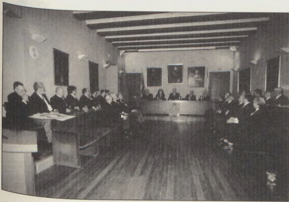
La Corporación académica reunida en sesión pública.

nuevo personal técnico que se suma al que ya disponía.